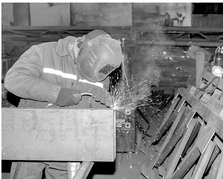
Специалисты «АМК» следят за качеством выпускаемой продукции и выполненной работы.