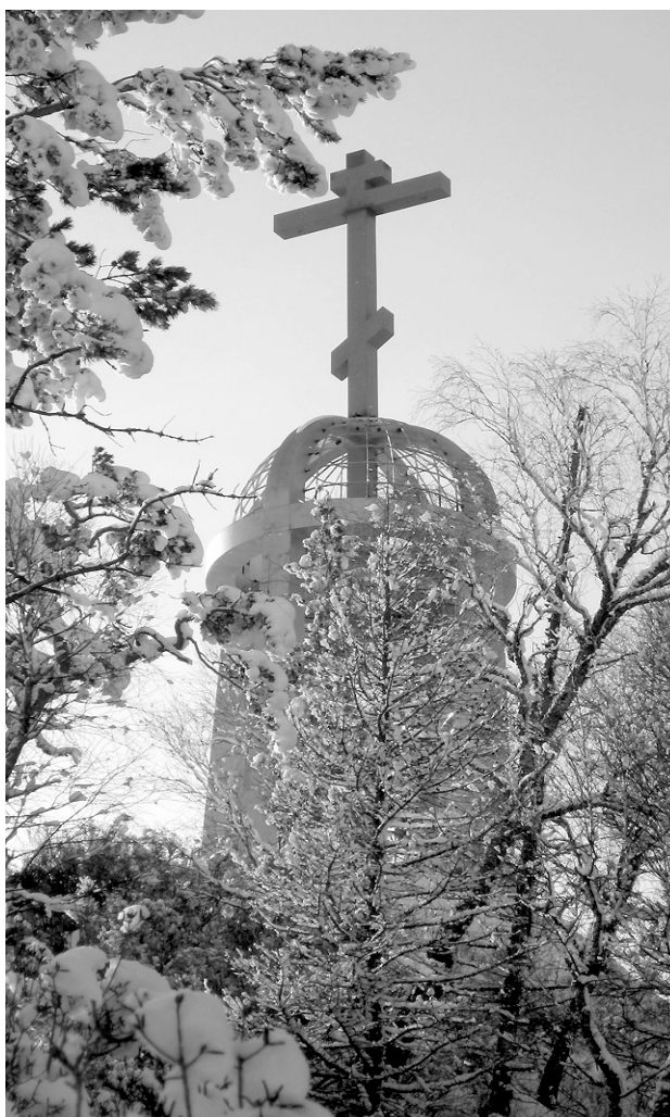
На монтаж стелы с крестом на Алтае ушло три месяца, это был уникальный и полезный опыт.

— Безусловно. Когда заходишь на такой объект, то изначально, признаюсь, страшновато, поскольку ещё не знаешь, как именно работать в таких, несколько нестандартных, условиях. Даже с тем крестом —