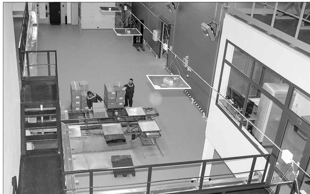
На транспортёрную линию загружаются коробки с препаратами.

От научной идеи до аптеки лекарство доходит через 6—10 лет.