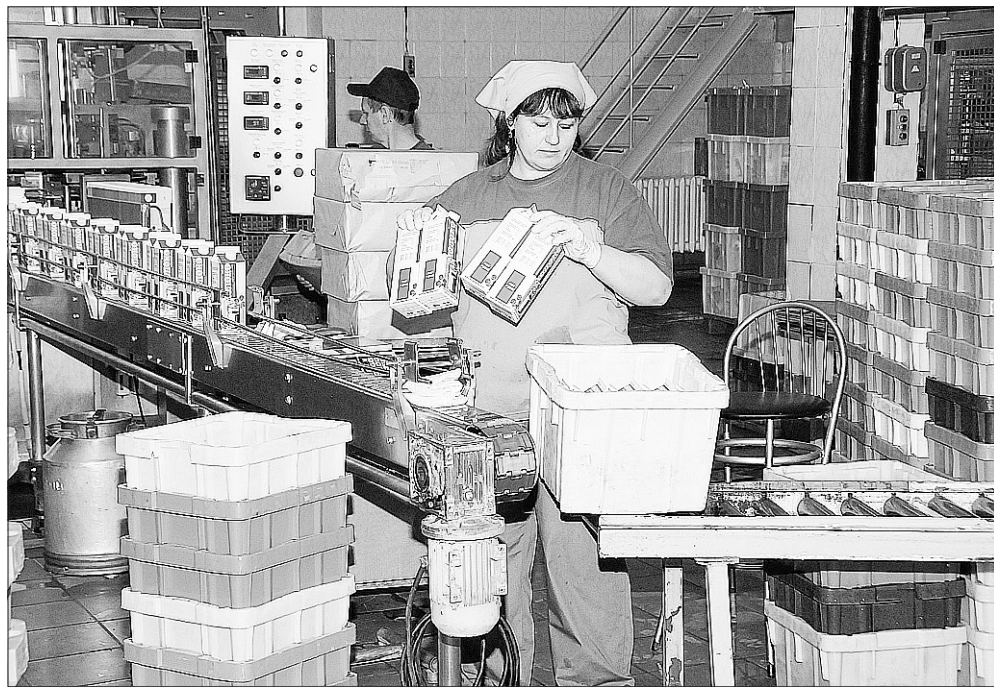
Молоко поступает на завод сразу после дойки, потому и продукция вкусная.