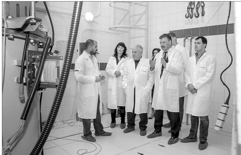
Особое внимание депутатов привлёк ядерный ускоритель ИЯФ СО РАН.

К 2016 году объём налоговых поступлений в бюджет области от резидентов биотехнопарка должен превысить миллиард рублей.