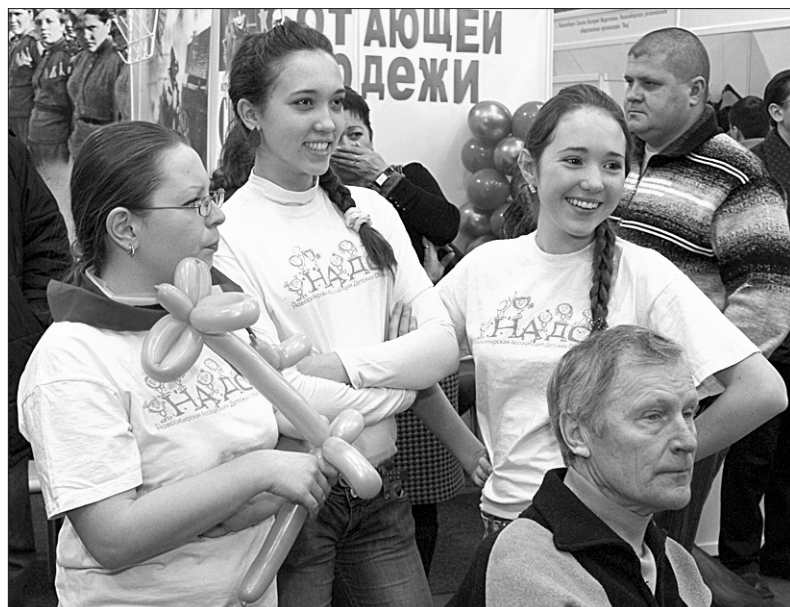
Среди 56 НКО, получивших субсидии из бюджета в 2011 году, — Городская общественная детская организация «НАДО» со своим проектом «Играют все!».

Уверена, проекты по этим и другим направлениям социально значимой деятельности будут реализованы в Новосибирской области в ближайшем будущем. Ведь неравнодушных людей у нас, к счастью, большинство. Нужно только помочь им раскрыть свой профессиональный и творческий потенциал. И в этом, по-моему, заключается наша самая главная задача. ■